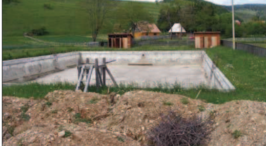
A csomortáni strand ma, és a létesítménynek a helyi önkormányzat által elképzelt jövője. Kellemes pihenőbázis lenne az egykori „reumaközpontból”

Nagy infrastrukturális beruházás előtt áll Csíkpálfalva község, a helyi önkormányzat EU-s finanszírozásból 7,2 kilométer községi útszakasz aszfaltozására hirdet közbeszerzési eljárást, előbb a részletes kivitelezési tervre, majd magára a kivitelezésre. A többkomponensű projekt összértéke 2,5 millió euró, a község három települése utcáinak aszfaltozása mellett a lehívott összegből felújítják a csíkpálfalvi és csikdelnei kultúrházakat, továbbá Delnén egy 369 négyzetméternyi alapterületű napközi otthon is épül. A település föld alatti infrastruktúrájának kiépítése az elmúlt években befejeződött, az ivóvíz- és csatornahálózat üzemel, így lehet folytatni a községfejlesztést az utak aszfaltozásával. Az úttest felújítása mellett az út menti csapadékvíz-elvezető árkokat is kicéptik, illetve a projekt részeként járdát is létesítenek az aszfaltozott szakaszok mellé.